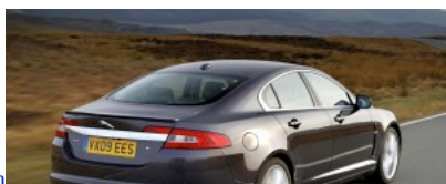
1. Jaguar XF : guide d'achat occasion