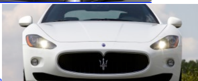
2. Maserati Granturismo : guide d'achat occasion