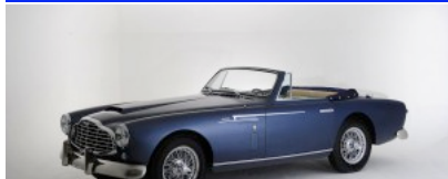
3. Naissance annoncée de la Bugatti Type 64... 70 ans après