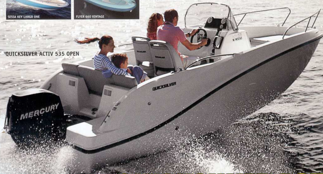
QUICKSILVER ACTIV 535 OPEN