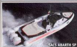
SACS ABARTH SP