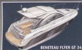
BENETEAU FLYER GT 34

RECEVEZ UNE INVITATION AU NAUTIC VOIR PAGE 27