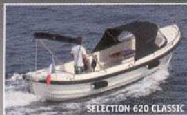
SELECTION 620 CLASSIC