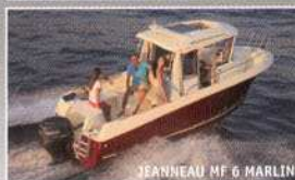
JEANNEAU MF 6 MARLIN