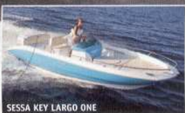
SESSA KEY LARGO ONE