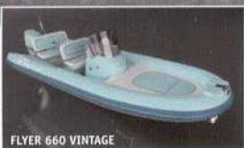
FLYER 660 VINTAGE