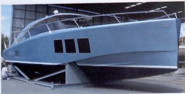
UFO U119 In-bord

Un an après le lancement du U119, le chantier toulonnais propose une alternative in-bord de son superbe bateau. Le design est toujours là, les matériaux toujours aussi novateurs avec du carbone ou du Kevlar, mais avec en plus le couple des deux moteurs FPT intégrés et un accès à la mer plus aisé.