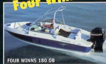
FOUR WINNS 180 OB