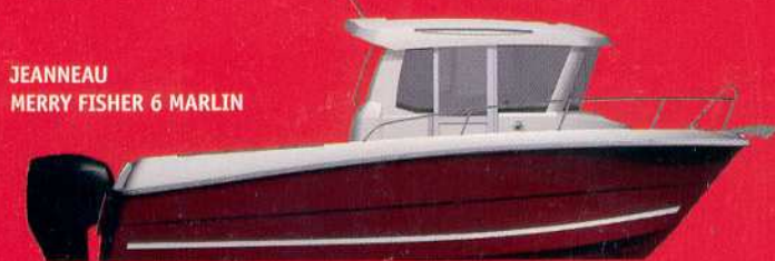
JEANNEAU MERRY FISHER 6 MARLIN