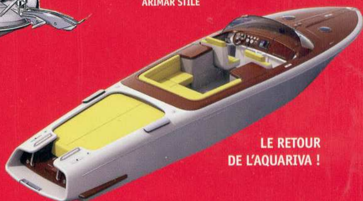
LE RETOUR DE L'AQUARIVA !