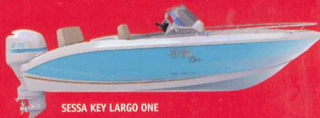
SESSA KEY LARGO ONE